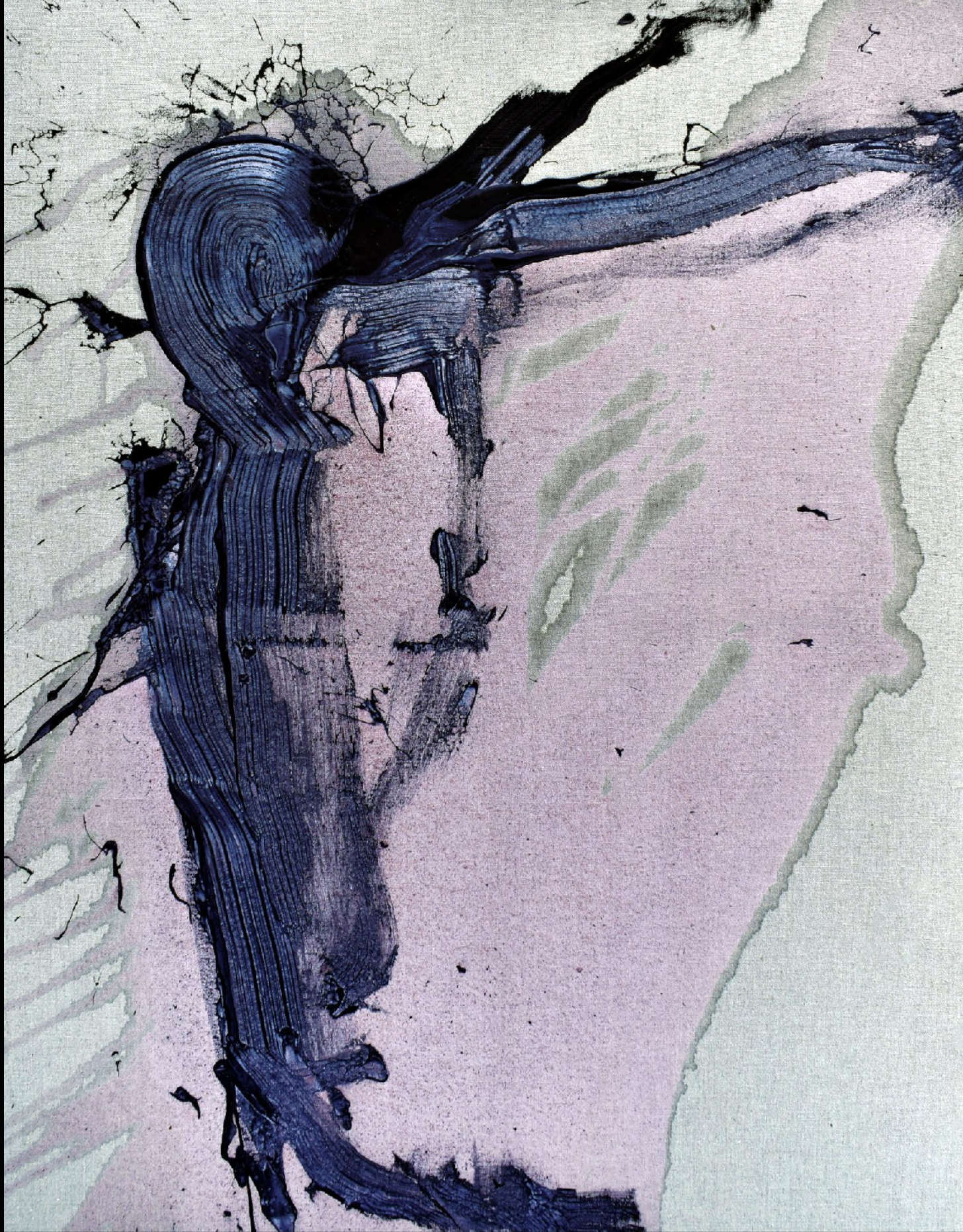
A DIFFERENT FIGURE / EINE ANDERE FIGUR / JINÁ FIGURA