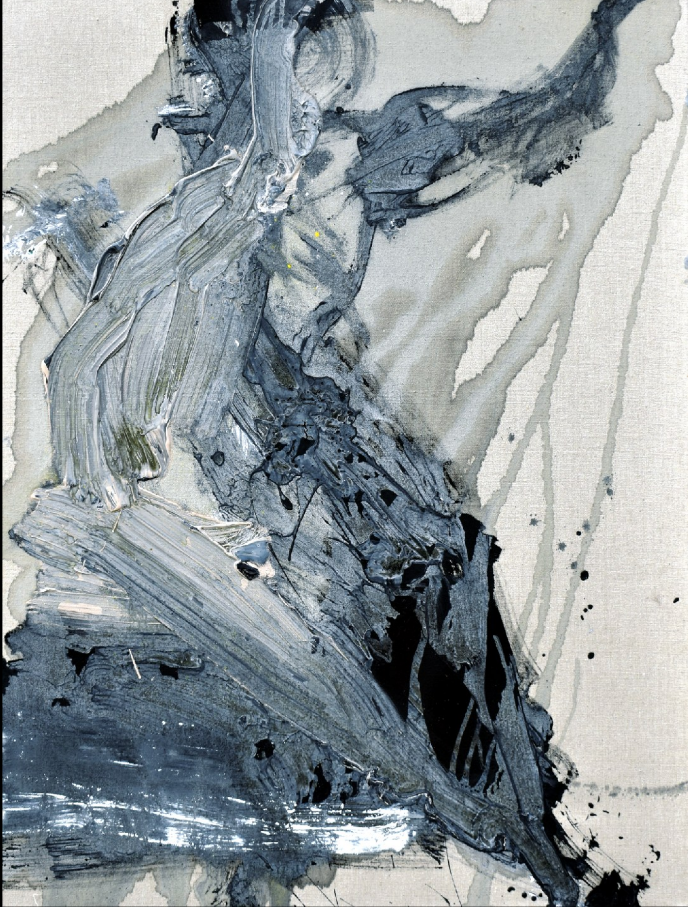
FIGURE I. / FIGUR I. / FIGURA I.