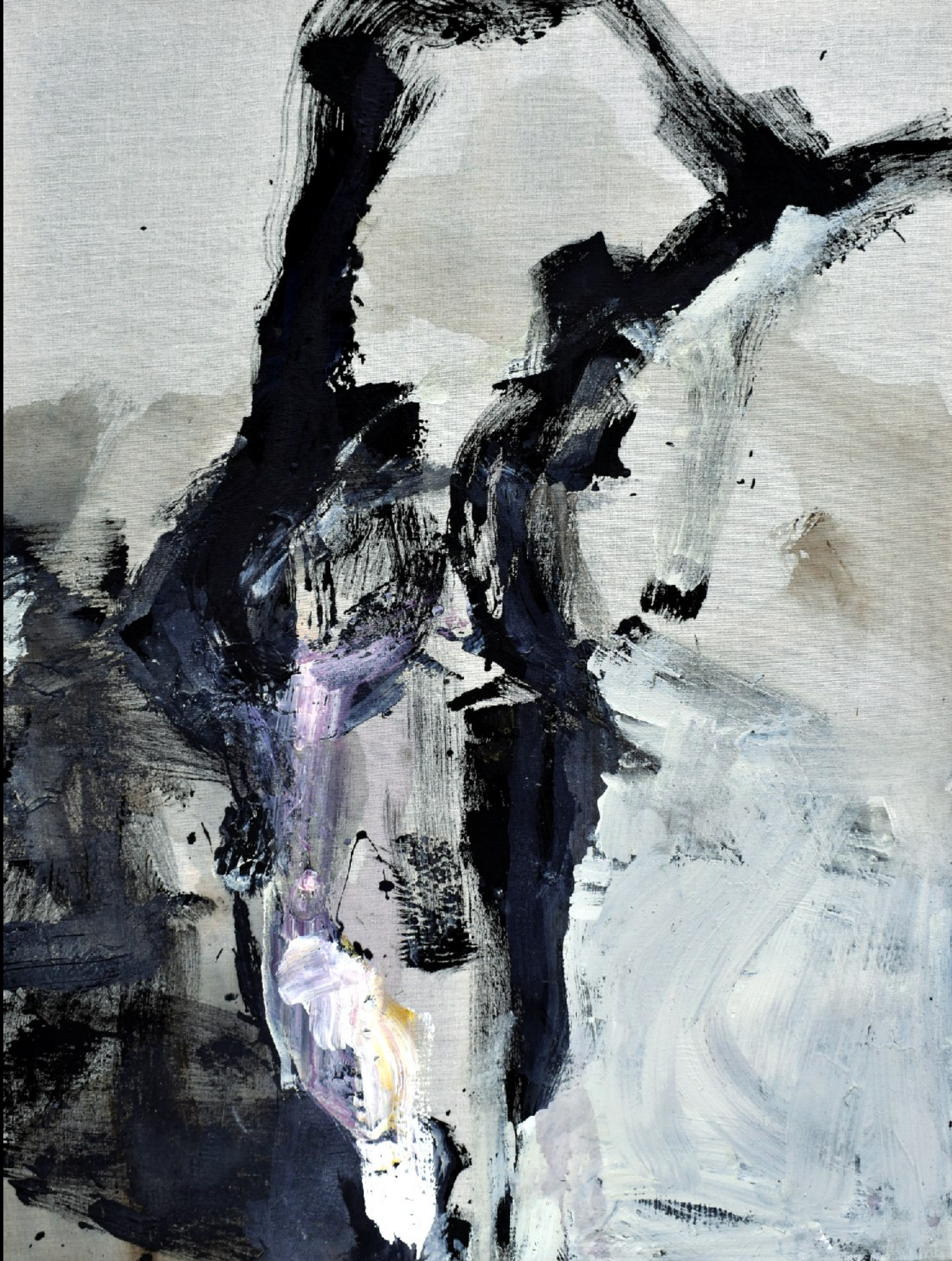
ONE NEXT TO THE OTHER / EINER NEBEN DEM ANDEREN / JEDEN VEDLE DRUHÉHO