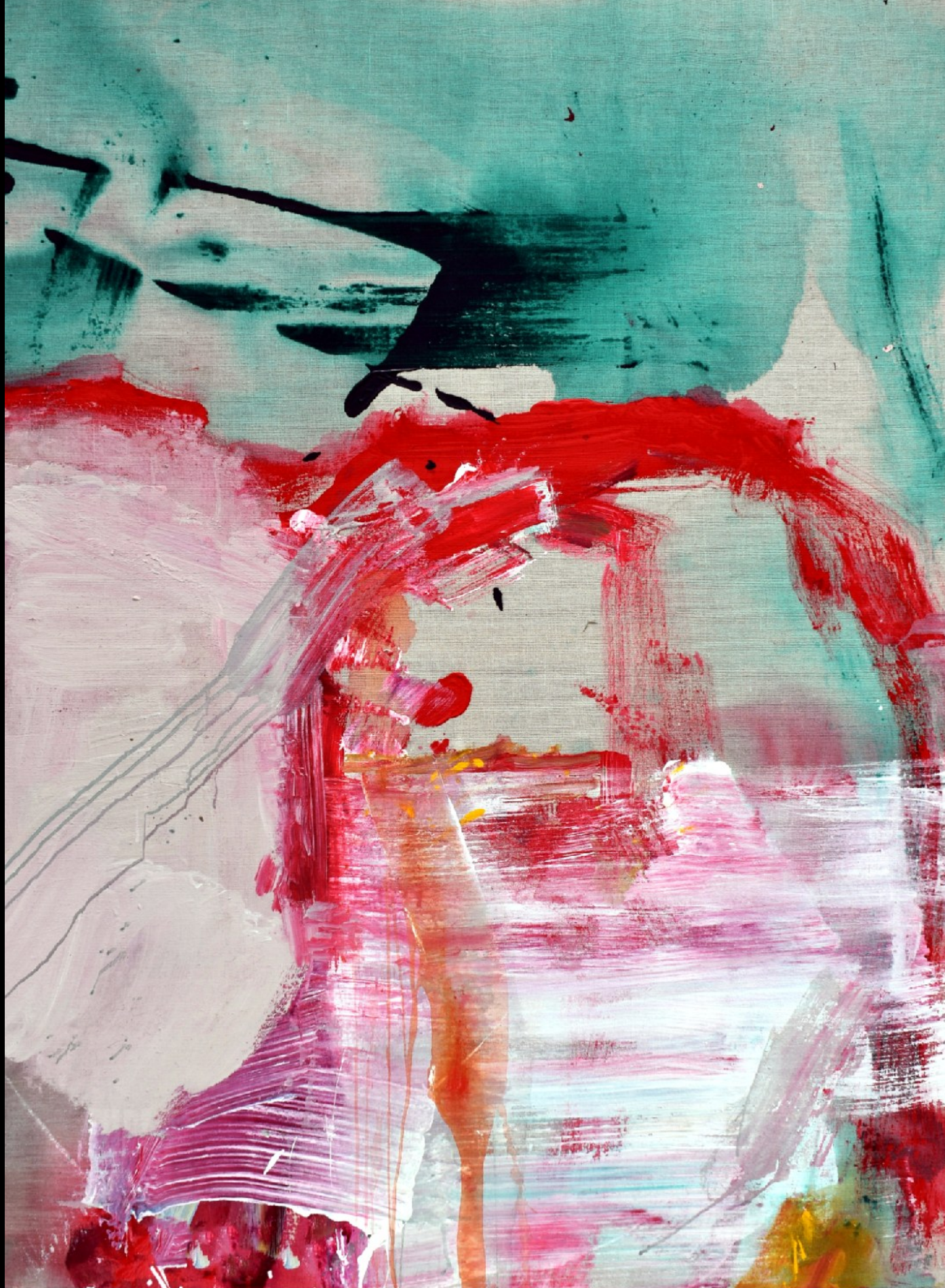
ON A SUMMER DAY / EINES SOMMERTAGES / LETNÍHO DNE 2018 / 140 x 110 cm