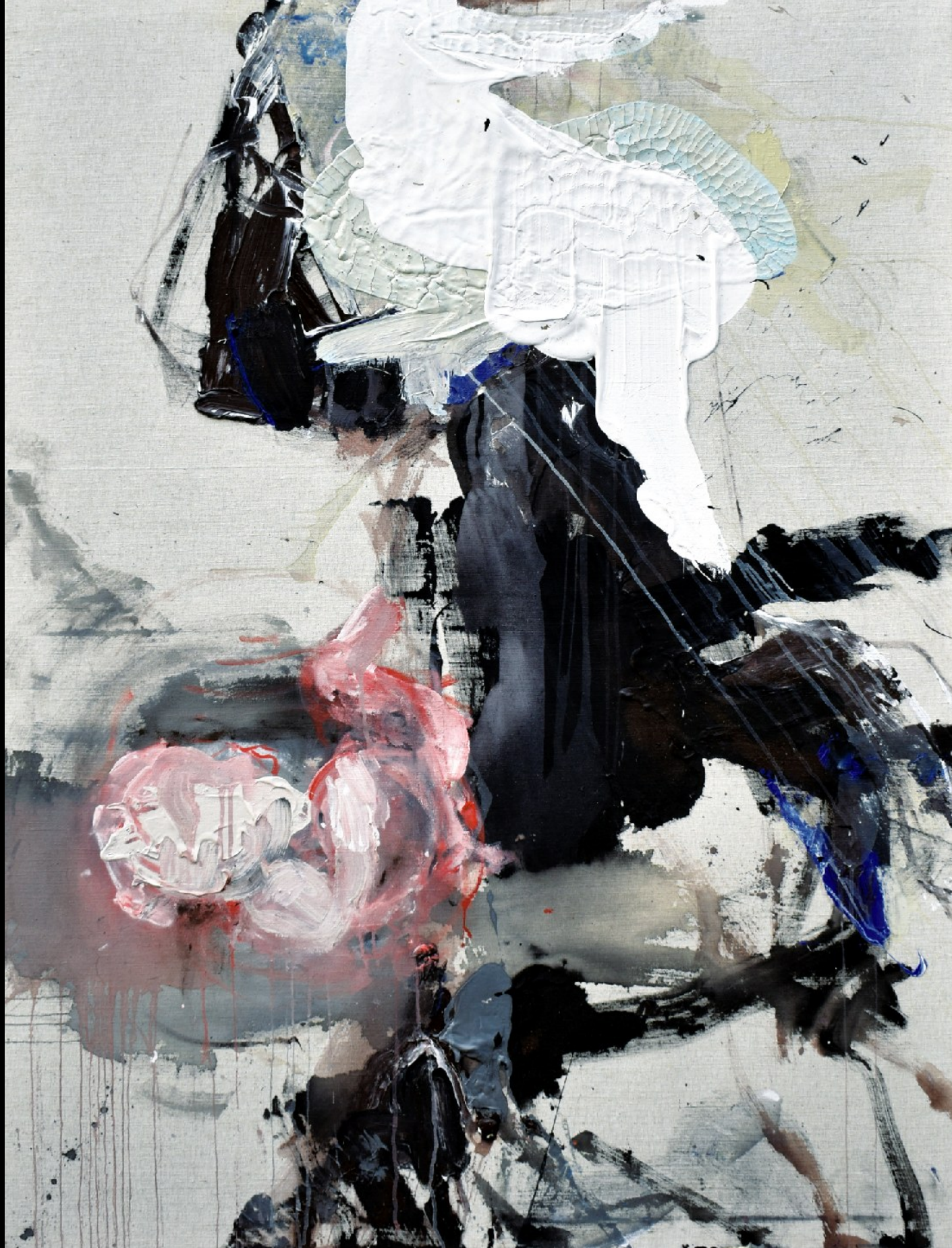
FOR ADAM / FÜR ADAM / PRO ADAMA